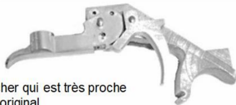
Platine du Baumkircher qui est très proche de l'original