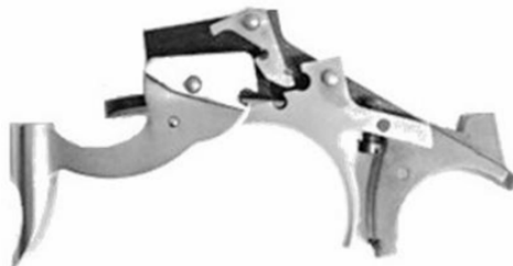
Platine du Feinwerkbau History n°1 qui n'est pas fidèle à l'original donc refusée.