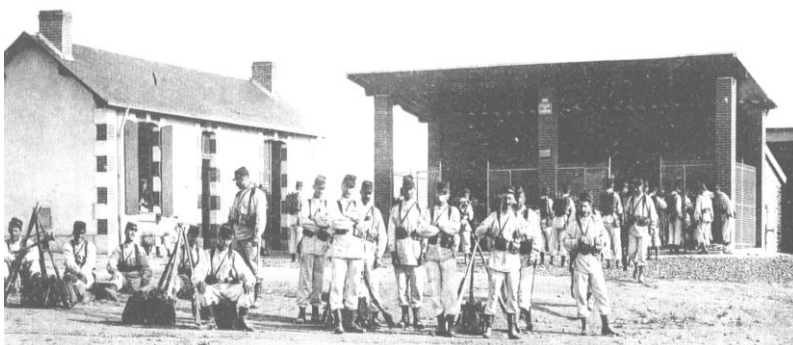
Stand de tir d'Ancenis, en 1904. Le 64 ème Rgt Infanterie au tir

La section des Arquebusiers de la Duchesse Anne (A.D.A) , est membre des A.D.F , et regroupe des tireurs issues des différents clubs de tir FFtir de Loire Atlantique est des départements limitrophes.